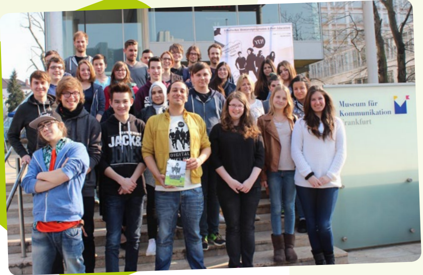
Digitale Helden aus der Schillerschule, Schule am Sommerhoffpark und Carl- Schurz-Schule im Februar 2016

Wir danken unseren Förderern für ihre großzügige Unterstützung mit Know-how, Kontakten und Finanzen. Durch ihren Einsatz wird der Kostenbeitrag der Schulen so niedrig und stabil gehalten.